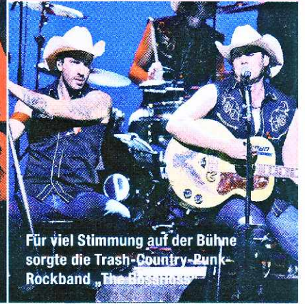
Für viel Stimmung auf der Bühne sorgte die Trash-Country-Runk-Rockband „The Runkers“