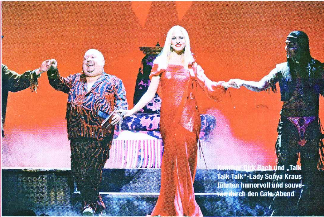
Komiker Dirk Bach und „Talk Talk Talk“-Lady Sonya Kraus führten humorvoll und souverän durch den Gala-Abend