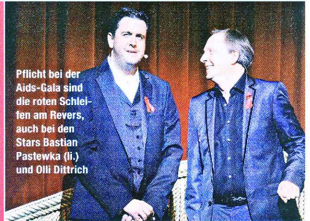
Pflicht bei der Aids-Gala sind die roten Schleifen am Revers, auch bei den Stars Bastian Pastewka (li.) und Olli Dittrich