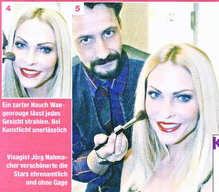
4 Ein zarter Hauch Wangenrouge lässt jedes Gesicht strahlen. Bei Kunstlicht unerlässlich