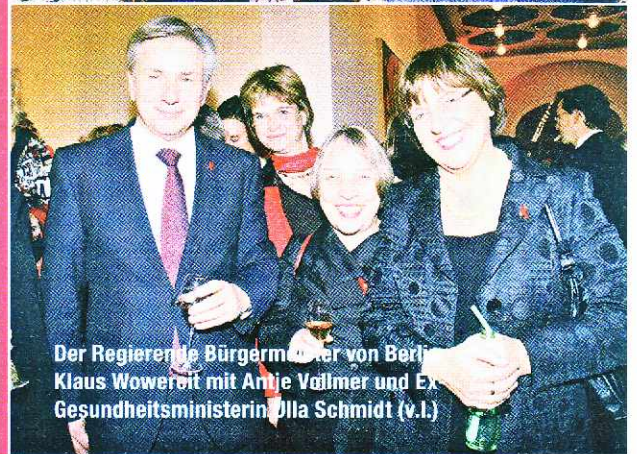
Der Regierende Bürgermeister von Berlin Klaus Wowereit mit Antje Vollmer und Ex-Gesundheitsministerin Ulla Schmidt (v.l.)